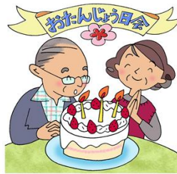
デイサービスの広場