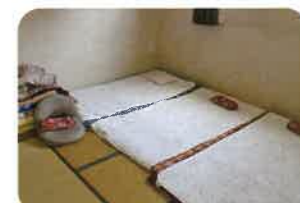
▲休憩室でお昼寝してリフレッシュ