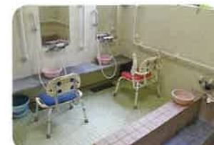
▲身体状況に合わせて共同浴や個浴できます