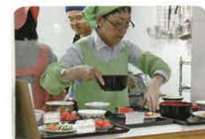
▲栄養バランスのとれた温かい食事を提供