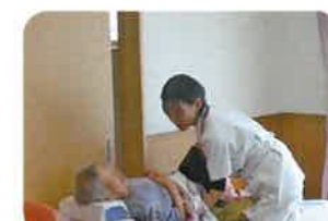
▲マッサージで体のケア