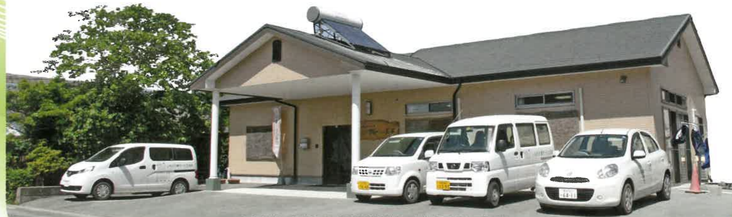
デイサービス しもだ介護サービス玉名 全景

【低周波治療器】や【湿式ホットパック装置】もご利用できます。それぞれ、痛みの軽減、代謝の促進、血行促進などを目的とします。